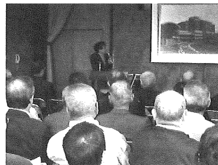
岡崎公民館で65名が

聴講しました。 睡眠中に10秒以上の呼吸停止が1時間に5回以上起こる症状で、酸欠になり安眠できないため日中の眠気・集中できない等、事故を起こしたり、脳卒中や心筋梗塞などの原因になります。心当たりがあれば、耳鼻科で診察を受けましょう。