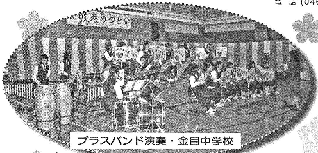
ブラスバンド演奏・金目中学校