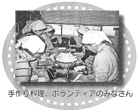
手作り料理、ボランティアのみなさん

当日は、女性委員とボランティアの方々皆で力を合わせ、彩りも美しい手作りのちらし寿しとお弁当、そして豚汁などを心をこめて作りあげていただきました。初参加の私は、先輩方の手際の良さと出来ばえに、ただただ驚くばかりでした。準備もすべて整い、暖かい日差しがふり注ぐ中、和やかな雰囲気でお食事が進められました。余興の歌や踊り、全員での合唱など大いに盛り上がり、あつという間に閉会の時間となりました。帰り際の皆様の笑顔と、「おいしかったよ」の一言に充実した一日を過ごせることが出来、感謝の気持ちでいっぱいでした。