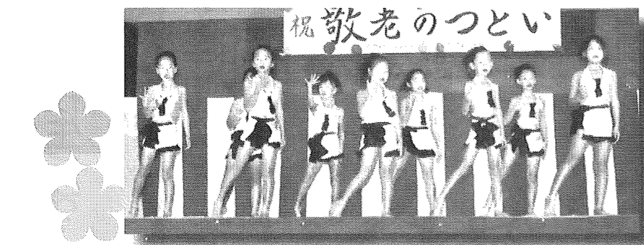
児童ダンス プリティーキッズ